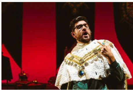
Sánchez realizará dos pases el sábado 14 de junio en el Gran Teatro.

Cristina Abad Cabal. Manu Sánchez vuelve a nuestra ciudad una vez más para hacernos reír, en esta ocasión con una obra de teatro que plasma en tono cómico la actualidad de la monarquía. El humorista sevillano, llega a Priego de Córdoba para presentar su último trabajo teatral "El rey solo, mi reino por un puchero". El Teatro Victoria disfrutará de su humor el próximo sábado 24 de enero.