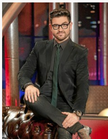
Uno de los proyectos del sevillano es exportar espectáculos a México.

hasta ahora todas las funciones de El Rey Solo se han saldado con un lleno . Entendemos que la obra ha gustado, está gustando y ahora que la Monarquía está en plena actualidad, quizás esto sea un añadido. Algunos irán por el morbo, algunos por la curiosidad y otros por el placer de asistir al reto de adaptar una obra en tan poco tiempo. Pero en el fondo, soy consciente de que la mayoría viene por mi físico .